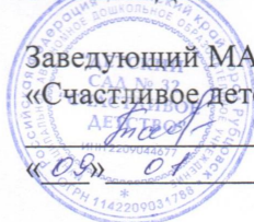
График работы сотрудников МАДОУ «Д/с № 32 «Счастливое детство» на 2017 год